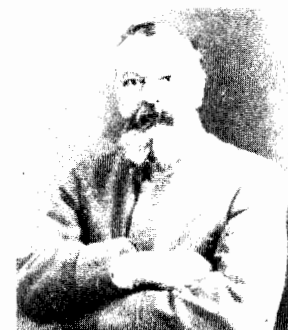
PAPUS EN 1916